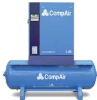
Kompressor auf Druckluftbehälter